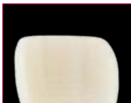
> Strato troppo sottile