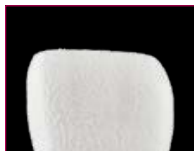
> Strato troppo spesso