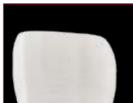
> Spessore ottimale