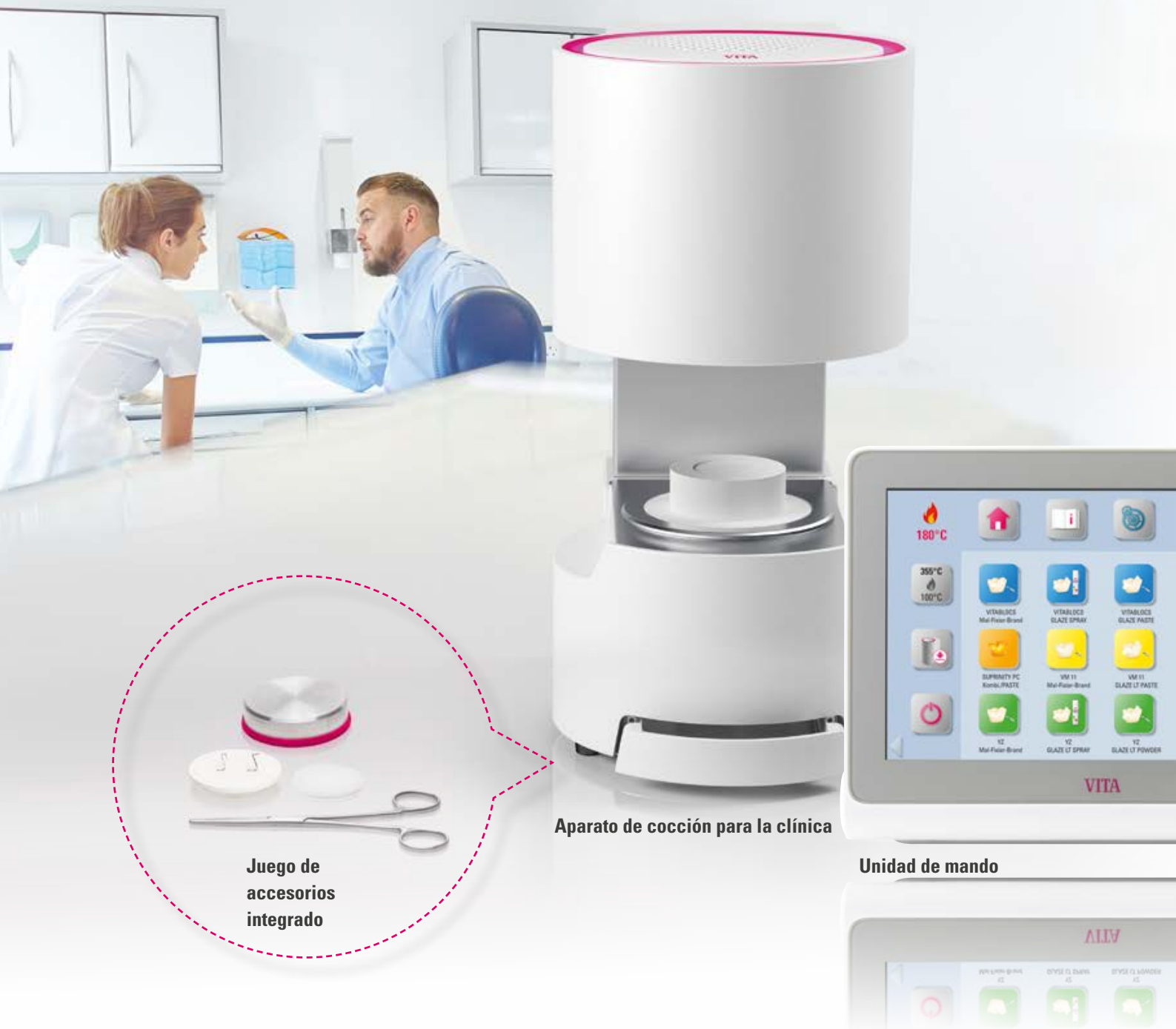
Aparato de cocción para la clínica