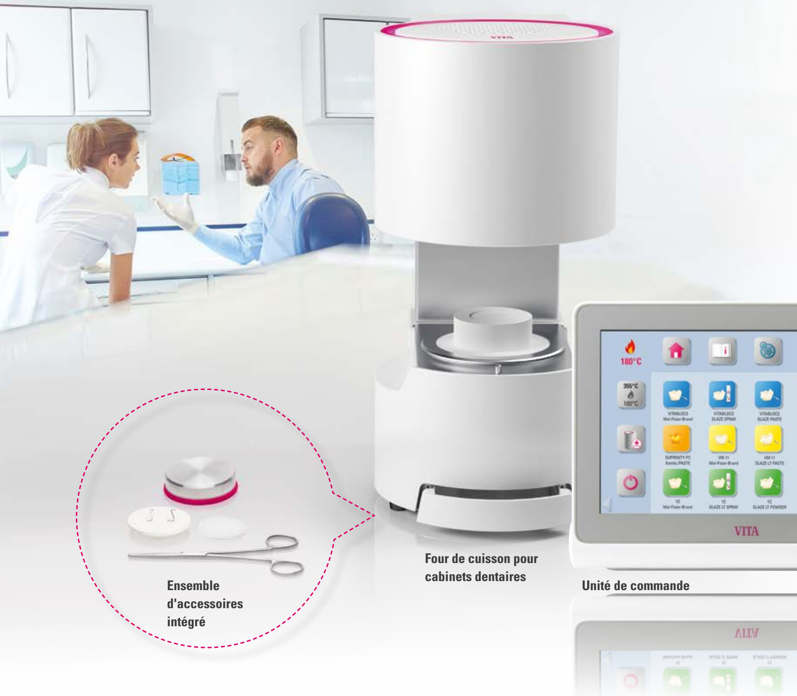
Ensemble d'accessoires intégré