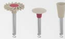
Polissage haute brillance