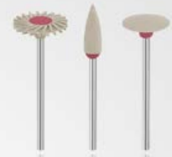
Polissage haute brillance