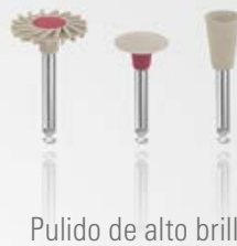
Pulido de alto brillo