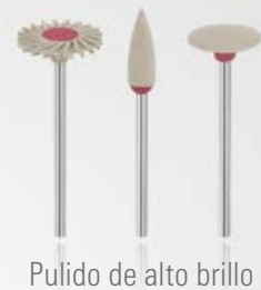
Pulido de alto brillo