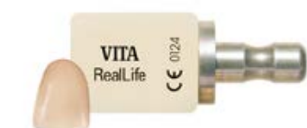
Мелкодисперсная керамика из полевого шпата