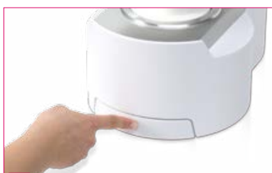
4 Retirez l'accessoire après avoir exercé une pression sur l'extrémité du tiroir.