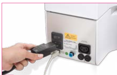
2 Branchez le four au réseau électrique.