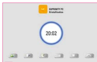
6 Démarrez le cycle de cuisson.