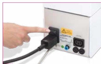
3 Actionnez l'interrupteur principal.