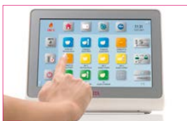
5 Sélectionnez le programme de cuisson.