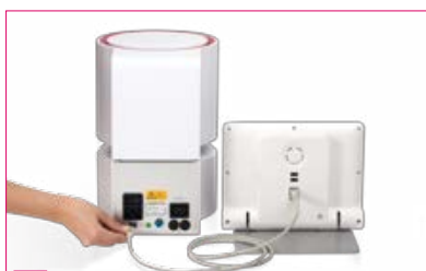
1 Connectez le four et l'unité de commande avec le câble de liaison.