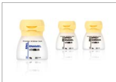
Zdj. 1: VITA VM 11 masy efektów