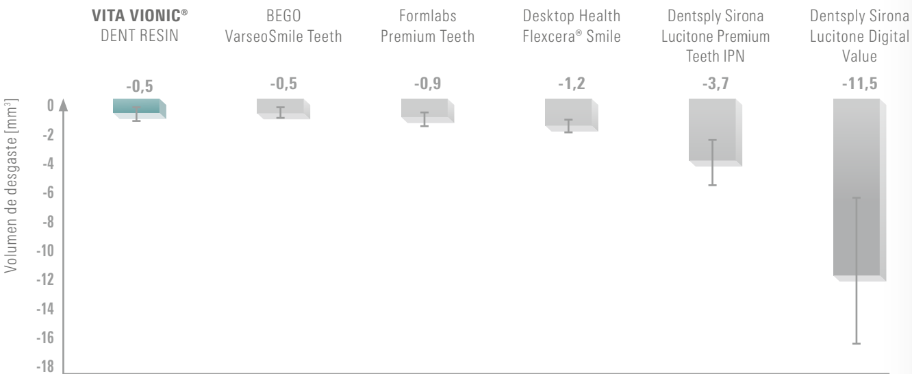
Volumen de desgaste

El gráfico lo pone de manifiesto: VITA VIONIC DENT RESIN presenta valores de desgaste muy bajos en la comparación. En consecuencia, cabe esperar un rendimiento excepcional en cuanto a la durabilidad en el uso clínico. La estabilidad de los dientes protésicos de VITA VIONIC DENT RESIN es equiparable a la de las prótesis fresadas y los dientes preconfeccionados.