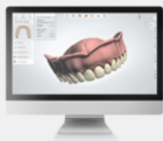
VITA VIONIC® DIGITAL VIGO Base de datos de dientes protésicos