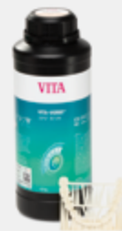
VITA VIONIC® DENT RESIN