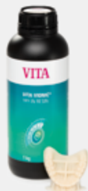
VITA VIONIC® TRY-IN RESIN