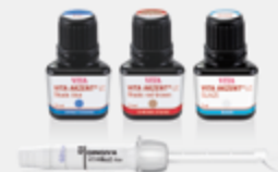
VITA AKZENT® LC VITAVM®LC flow