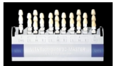
Abb. 2: Zahnfarbenring VITA SYSTEM 3D-Master®.