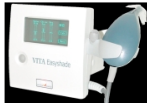
Abb. 1: Farbmessgerät VITA Easyshade. Ein handliches Tischgerät zur Messung und Analyse der Grundfarbe eines Zahns.

holungen, was sich in eine entscheidende Qualitätsverbesserung mit markanter Rationalisierung im Arbeitsprozess umsetzt.