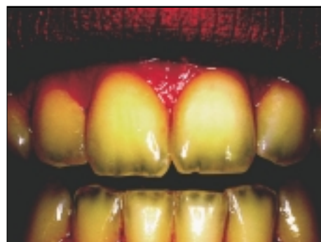
Abb. 6: Darstellung der Transparenzzonen, Mamelons, Heiligenschein etc. mittels Bildbearbeitung.