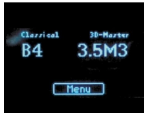
Abb. 11: Die erhobenen Messwerte werden in den Code des 3D-Master-Farbsystems umgesetzt.

NA zur Anwendung, so ist bei den Kontrollmessungen im Labor darauf zu achten, dass die Farbe des Stumpfmodells jener des Zahnstumpfes in situ einigermaßen entspricht. Dies hängt mit der grundsätzlich erwünschten Transparenz von ALUMINA zusammen: Ein weißes Gipsmodell