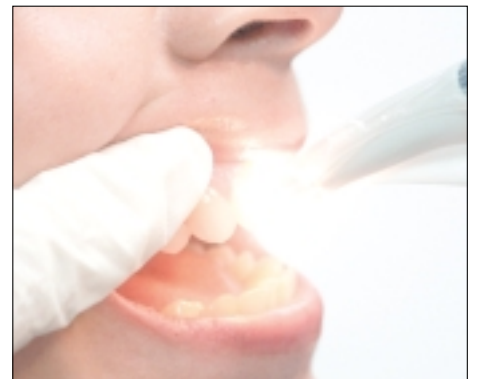
Abb. 9 und 10: Messvorgang mit Easyshade: Die Messspitze wird senkrecht und distanzfrei auf den Zahn gesetzt. Sie soll auch nicht teilweise über die Umgrenzung des Zahnes hinausragen.

NA zur Anwendung, so ist bei den Kontrollmessungen im Labor darauf zu achten, dass die Farbe des Stumpfmodells jener des Zahnstumpfes in situ einigermaßen entspricht. Dies hängt mit der grundsätzlich erwünschten Transparenz von ALUMINA zusammen: Ein weißes Gipsmodell