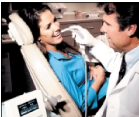
Abb. 8: Farbmessung am Patienten – Ganzflächig oder zonal.

Alle liebevollen Einbringungen von korrekt erkannten Effekten in eine Rekonstruktion sind leider vergeblich, wenn die Grundfarbe ungenügend erkannt ist. Das Fotospektrometer Easyshade bestimmt im Gegensatz zum menschlichen Auge unbeirrt die Grundfarbe eines Zahnes und gibt sie im Code des 3D-Master-Farbsystems wieder. Die Mes-