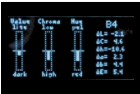
Abb. 13 und 14: Nicht unbedingt notwendig aber interessant: Wer wissen will, was farbmetrisch hinter der einfachen Angabe des 3D-Master-Codes 3.5M3 steckt, kann auf dem Display von Easyshade Informationen abrufen.

3.5 und rechts die Intensitätsstufe 3 im Säulendiagramm gekennzeichnet. In der Mitte erkennt man die 6 Positionen rund um den Mittelzahn (Hexagon im 3D-Master-System). Das Kreuz symbolisiert die Position der gemessenen Farbe. Wer sich noch tiefer in die Farbauswertung von Easyshade begeben will, kann zudem die Helligkeitswerte, Intensitätswerte und Farbwerte einzeln abrufen und die Abweichungen zum Referenzzahn einzeln ablesen (Abbildung 14).