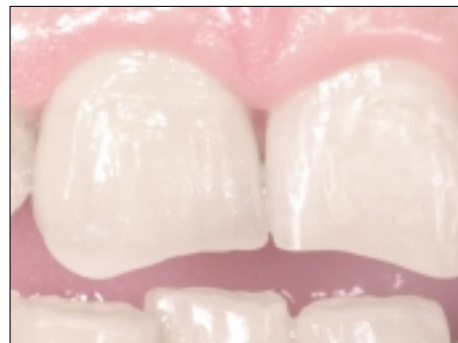
Abb. 4: Zahn 21 ist der natürliche Zahn und auf Zahn 11 ist eine vollkeramische Krone eingegliedert. Die raue Oberfläche, Querrillen, Längsrillen und Haarrisse vermitteln der Krone das natürliche Aussehen. Sie liegen im Schmelzbereich über dem Kern mit richtiger Grundfarbe, die ohne diese Effekte ein gänzlich anderes Erscheinungsbild erzeugen würde.

Bei der Effektanalyse sind die diversen Lichtreflexionen in der Zahnschubstanz und die Beschaffenheit der Oberfläche zu definieren. Je nach Größe, Menge und Form von Kristallen und Einschlüssen in der Zahnschubstanz setzen Lichtspiele ein, die mit den Begriffen Opazität, Transparenz, Transluzenz, Opaleszenz, Fluoreszenz etc. zu beschreiben sind. Insbesondere spielt dabei die Erkennung der Transluzenz eine Rolle (Abbildung 3). Sie streut das Licht und verwischt somit scharfe Konturen wie beispielsweise eine Kronenkappe hinter der Verblendung. Bei der Beschreibung der Zahnoberfläche sind deren Rauheit und die Einlagerung eventueller Perikymatien, Haarrisse und Flecken (Abbildung 4) zu definieren. Bei der Effektanalyse stellt die digitale Fotografie (Abbildung 5) eine sehr wichtige Dokumentation dar. Sie hilft bei der Gestaltung der Form und der