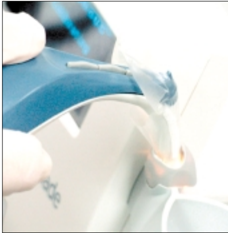
Abb. 7: VITA Easyshade: Automatische Kalibrierung durch Abstützung auf dem Kalibrierkörper.

renzzonen, Mammelons, Heiligenschein etc. (Abbildung 6) sehr eindrücklich.