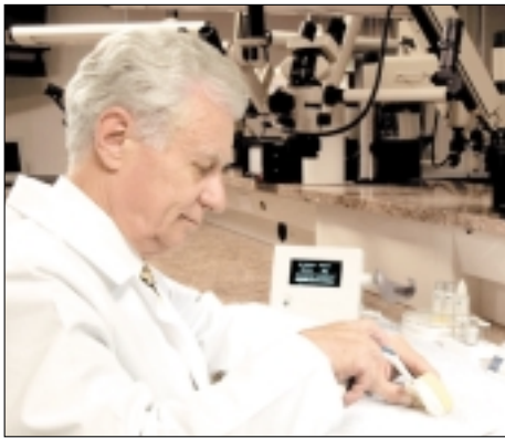
Abb. 12: Arbeitsbegleitende Farbüberwachung bei der labortechnischen Fertigung der Krone.

beispielsweise würde die Kontrollmessung gänzlich verfälschen.