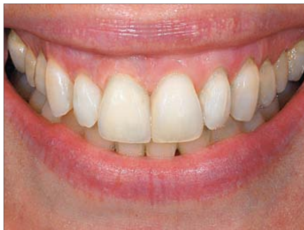
2. Rezultatul final cu o estetică plăcută, în urma reconstruirii gingiei și restaurării cu o coroană integral ceramică fabricată cu VITA VM 9.