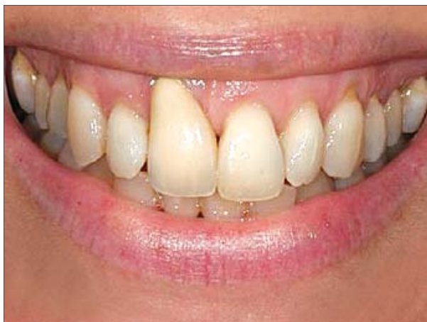
1. Situația inițială prezintă dintele 11 cu o retragere semnificativă a gingiei.

Cu VITA VM 9, puteți faceți față cu încredere cerințelor exigente.