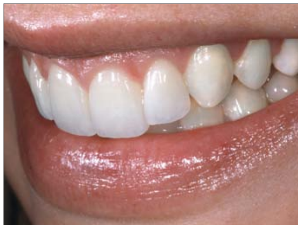
2. Muchia incizală și axul dintelui au fost uniformizate. Nu se observă că ar fi o restaurare.