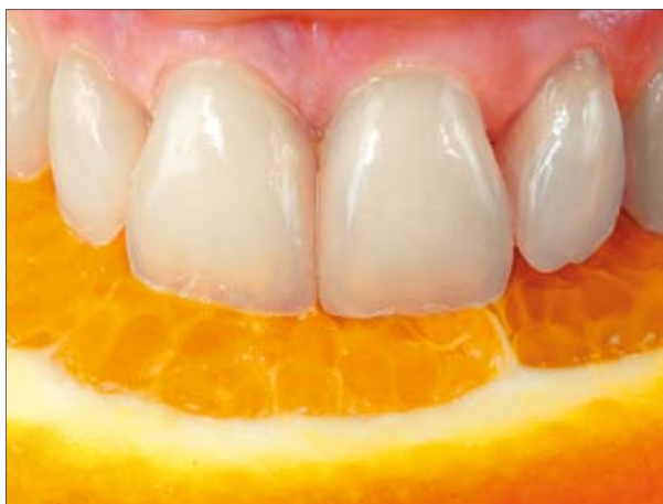
3. Rezultatul final cu o estetică remarcabilă.