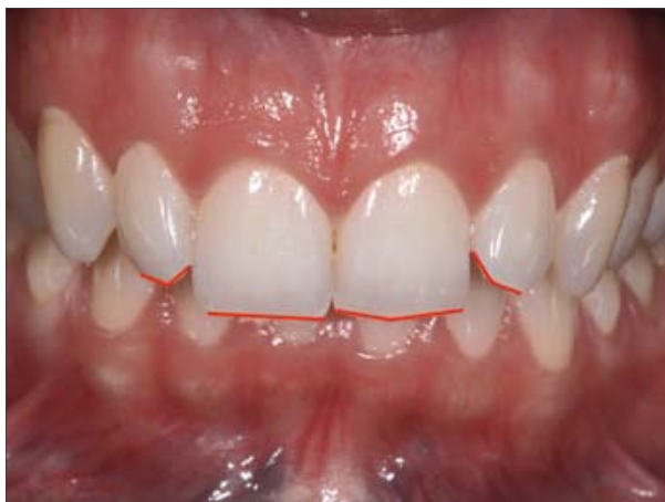
1. Linia roșie indică muchia incizală inițială, considerată neuniformă și neatrăgătoare.

Cu VITA VM 13 puteți obține restaurări de o estetică superioară cu efecte naturale de culoare.