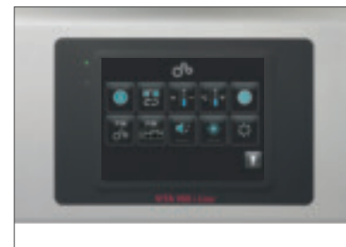
Programas básicos, de mantenimiento y control sumamente fáciles de manejar

1. Facilidad de uso: la pantalla táctil y los menús intuitivos facilitan en gran medida el trabajo con el VITA V60 i-Line. Su diseño minimalista y la robusta tecnología centran la atención en una función esencial: un proceso de cocción fiable.