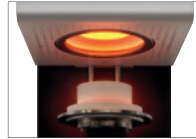
Risultati di cottura eccellenti