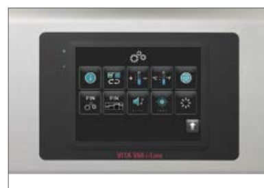
Programas de base, serviço e controle patricularmente de fácil utilização

1. Fácil de utilizar: o painel touchscreen e o menu de navegação autoexplicativo facilitam muito o trabalho com o V60 VITA i-Line. O design minimalista e uma tecnologia robusta atraem o foco para uma função central: o procedimento de queima confiável.