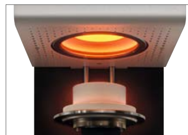
Excelentes resultados de queima