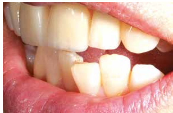
Abb. 10: Ansicht von links-lateral.