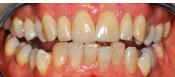
Abb. 15: Auch der Schneidekantenverlauf wirkt bei geöffnetem Mund natürlich.

Farben abgelenkt, sondern nehmen Schattierungen und Reliefs deutlich intensiver wahr. Den homogenen Farbeindruck der Kronen und Veneers bestätigt eine Verfremdung durch Farbumkehr: Mithilfe des Solarisationseffekts wird deutlich, wie eng die rottönenen Farbeffekte beieinander liegen (Abb. 13).