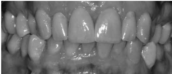
Abb. 12: Eine Schwarz-Weiß-Aufnahme hilft bei der letzten Formkontrolle; so werden auch feine Formabweichungen und Helligkeitsabstufungen deutlicher sichtbar.