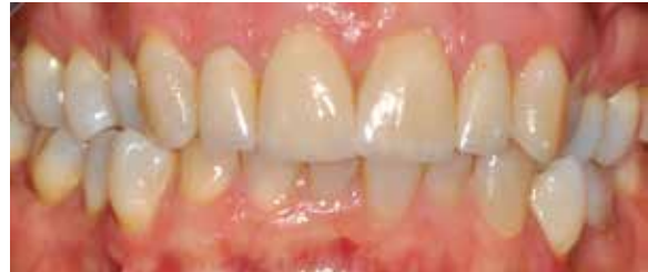
Abb. 8: Die fertigen Restaurationen weisen keine farblichen Unterschiede auf.

Ein gutes Hilfsmittel zur Beurteilung von Form und Oberfläche nach der manuellen Politur ist eine Schwarz-Weiß-Aufnahme bzw. ein in schwarz-weiß konvertiertes Farbfoto (Abb. 12). Hier werden unsere Augen nicht von