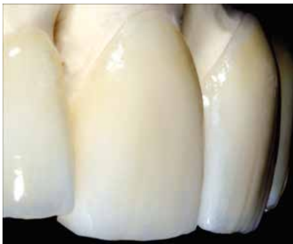
Abb. 5-7: Dank der Schmelzschichtung im Wechsel von Schmelz- und Effektmassen ergeben sich ein vielschichtiges Farbspiel und eine farbliche Harmonie.