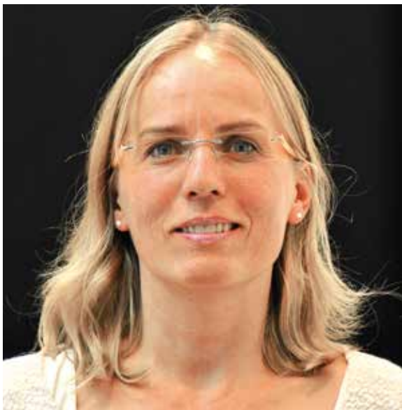
Abb. 14: Die Situation ein Jahr nach der Eingliederung: Harmonisch fügen sich die neuen Kronen und Veneers in das Gesicht der Patientin ein.