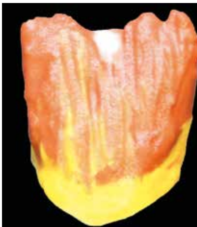
Abb. 2: Die Schichtung der Effektmassen: gelb-orange-rot im zervikalen Bereich, BASE DENTINE im Bereich des Zahnkörpers bis in den inzisalen Bereich hinein.

Da sich das Licht an jeder dieser Schichten unterschiedlich bricht bzw. reflektiert wird, erreiche ich ein vielschichtiges Lichtspiel mit Tiefenwirkung, das die Zahnstruktur lamellenartig einmal bläulich, einmal weißlich oder neutral sehr lebendig erscheinen lässt (Abb. 5-7).