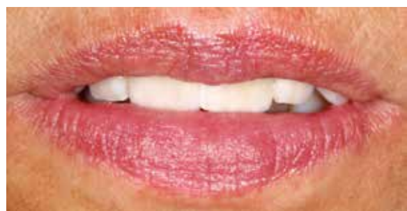
Abb. 11: Bei leicht geöffnetem Mund wirken die Restaurationen natürlich. Die leicht verschachtelte Stellung der Zähne 11 und 21 unterstützt diesen Effekt zusätzlich.