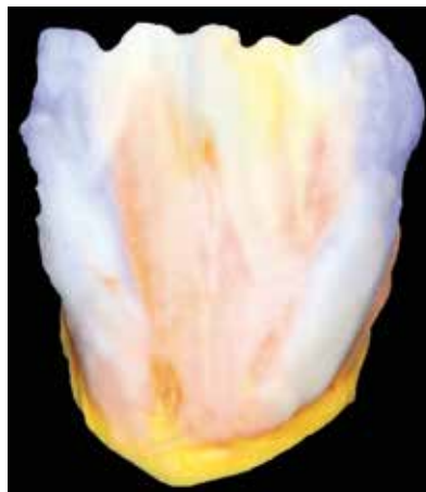
Abb. 3: Die Schichtung der Effektmassen: bläulich – EFFECT OPAL (EO3), gelb in der Mitte – MAMELON (MM1).