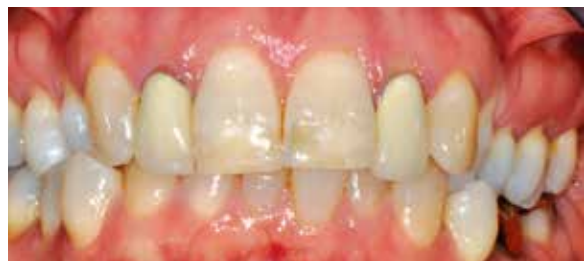
Abb. 1: Die Ausgangssituation mit VMK-Kronen auf den Zähnen 12 und 22 sowie deutlichen bräunlichen, gelblichen und orangefarbenen Verfärbungen an den unbeschleunigten Zähnen 11 und 21.

werden sollen (Abb. 1). Die Zähne 11 und 21 weisen bereits deutliche Verfärbungen an der Oberfläche auf, vorwiegend bräunlich, gelblich und orange. Nach einer substanzschonenden Veneerpräparation von ca. 0,3 bis 0,5 mm treten diese Farbstörungen inselartig noch deutlicher hervor als vor dem Beschleifen.