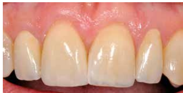
Abb. 9: Über die Opazität der Restaurationen und die Einfärbung des Befestigungskomposits gelingt bei den Veneers 11 und 21 die Maskierung des verfärbten Untergrunds.