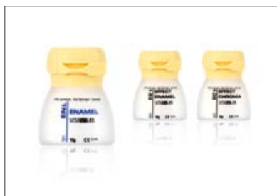
III. 1 : masses effet VITA VM 11