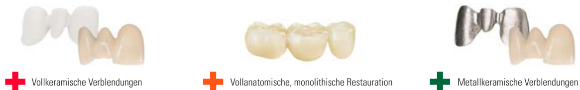
+ Vollkeramische Verblendungen + Vollanatomische, monolithische Restauration + Metallkeramische Verblendungen