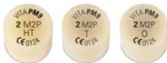
Tabla de colores de las pastillas O/T:

VITA PM 9 es compatible con el sistema de colores VITA SYSTEM 3D-MASTER.