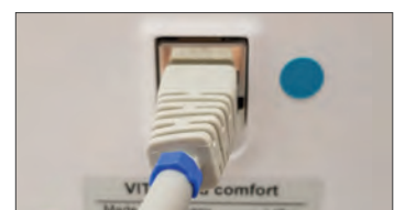
Neues vPad / Anschlusskabel (blauer Punkt + Ring)