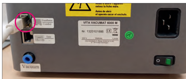
Oberer Anschluss verwenden (Brenngerät bis 04/2017)