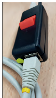
Injektor / Anschlusskabel (gelber Punkt + Ring)