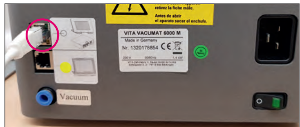
Oberer Anschluss verwenden (Brenngerät ab 05/2017)