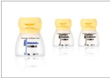
Fig. 1: Materiales de efectos especiales VITA VM 11