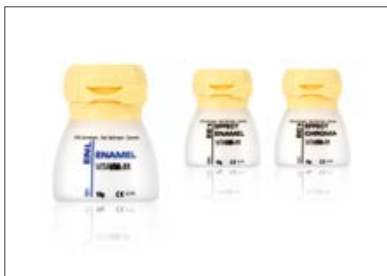
Fig. 1: masse effetto VITA VM 11