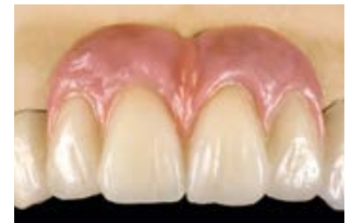
Überzeugende rot-weiß Ästhetik