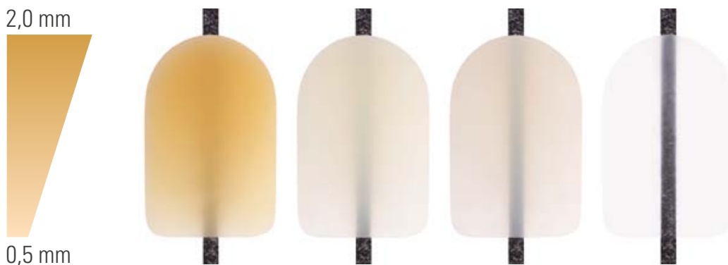
Verschiedene Transluzenzgrade anhand folgender Muster (von links nach rechts): CHROMA PLUS CP2, EFFECT ENAMEL EE2, ENAMEL LIGHT ENL, WINDOW WIN. Dickste Stelle (oben): 2,0 mm, dünnste Stelle (unten): 0,5 mm.