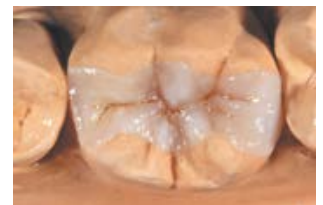
VITA VM LC Inlay, Copyright: ZTM Jürgen Freitag, Bad Homburg