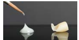
Die niedrigviskosen VITA VM LC flow Massen (links) sind die gelungene Ergänzung zu den bewährten VITA VM LC Pasten (rechts).