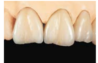
Zum Verwechseln ähnlich Zahn 11 VITA VM LC, 21 - 22 VITA VM 13

Und da sich mit VITA VM LC nun auch niedrigviskose und pastöse Konsistenzen kombinieren lassen, sind die Wege zur brillanten Ästhetik jetzt so vielfältig wie nie zuvor. Schnell, sicher, individuell. Das ist die neue Wahlmöglichkeit!