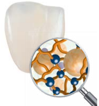
Netzwerkstruktur VITA VM LC

Das Ergebnis: Resultate, auf die man sich verlassen kann. Mit Sicherheit!