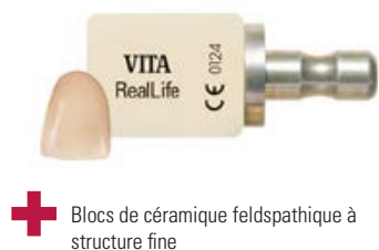
+ Blocs de céramique feldspathique à structure fine