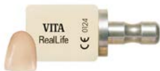
+ Blocchetti in ceramica feldspatica a struttura microfine