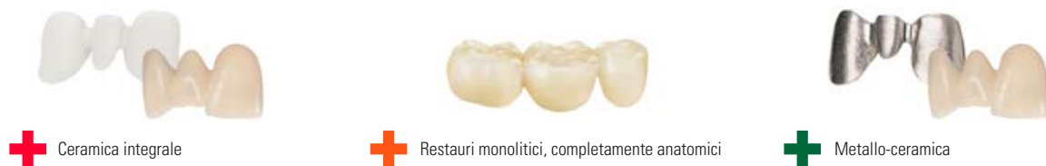
+ Ceramica integrale