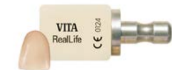
Мелкодисперсная керамика из полевого шпата